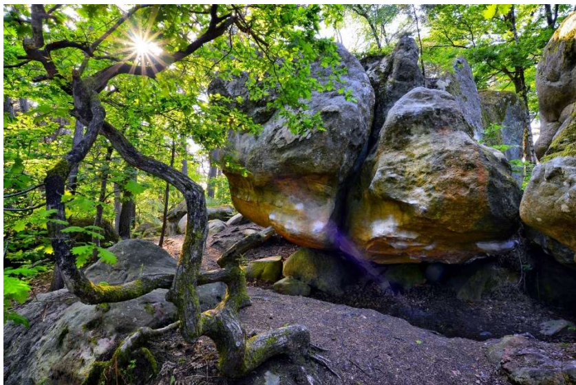
La forêt de Fontainebleau

L’objectif est une reprise en douceur de l’activité physique dans un espace naturel d’exception pour mettre en éveil les sens en faveur d’un apaisement de l’esprit. Se donner le temps pour le lâcher prise, s’autoriser ainsi à partir en week-end et court séjour simplement et confortablement pour garder un peu de bien-être dans la durée.