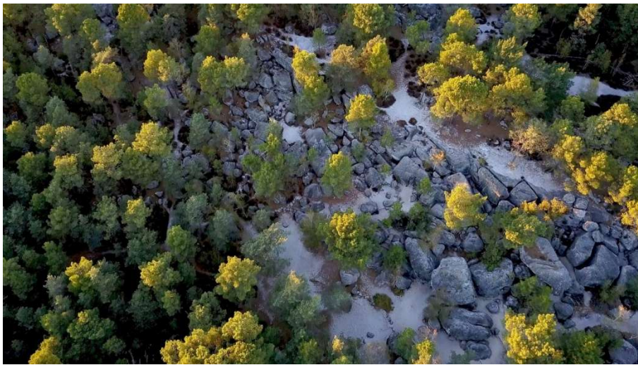
La forêt de Fontainebleau