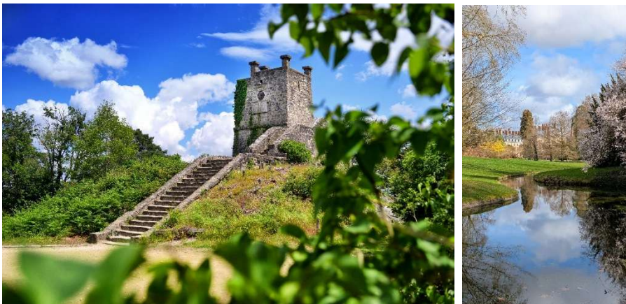
La Tour Denecourt / Le Jardin anglais au château de Fontainebleau

S'émerveiller devant la beauté d'un jardin anglais au château de Fontainebleau. Ce magnifique jardin, d'inspiration champêtre, reproduisant un paysage naturel, fleuri, vallonné et foisonnant est un havre de paix pour se reposer et rêver sur l'herbe fraîche en se laissant bercer par le doux son de la petite rivière qui le traverse. S'attarder sur les détails du parc et des jardins du château de Fontainebleau est également un délice pour les yeux.