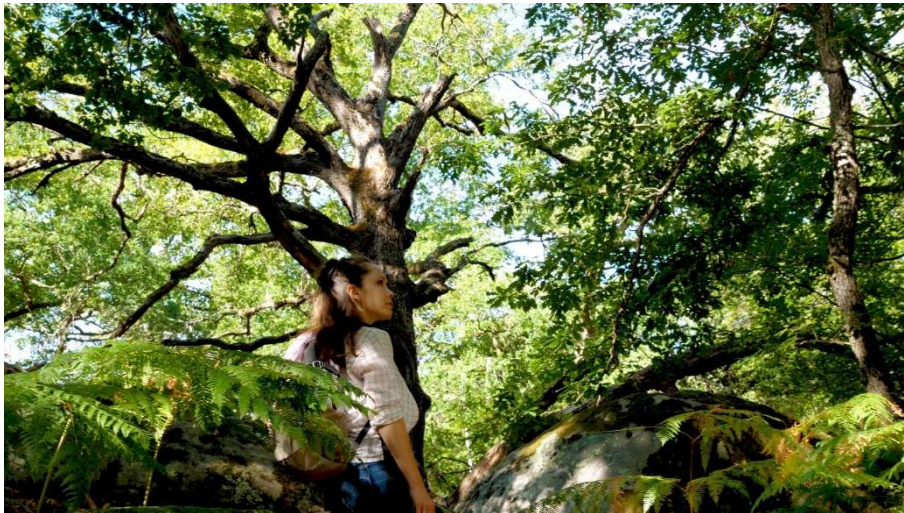
La forêt de Fontainebleau

(1)Haluzka D. et al., Forests, 2025 – étude expérimentale sur les effets d'une exposition de 20 minutes en forêt. Etude ici relayée ici