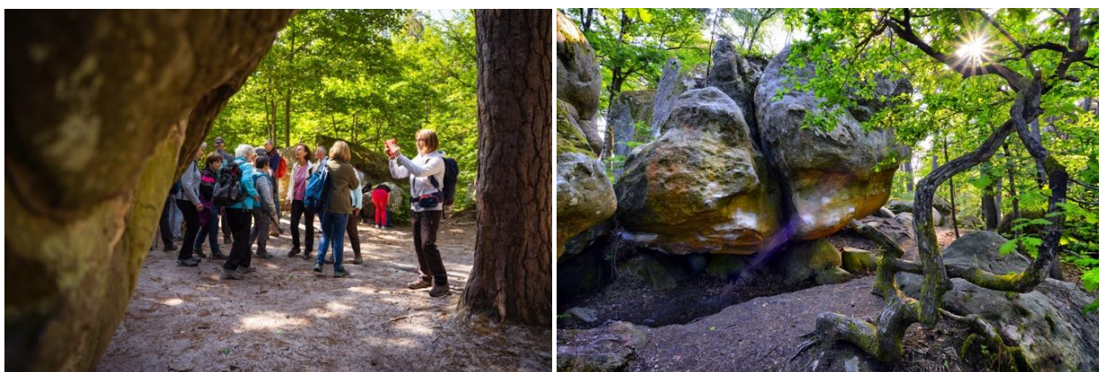
Forêt de Fontainebleau

Précieux réservoir de biodiversité , la forêt de Fontainebleau abrite une grande diversité de milieux avec plus de 5 685 espèces végétales et 6 000 espèces animales . Les sols, le relief et la végétation offrent une grande variété de paysages et d'écosystèmes forestiers . Elle fait l'objet de toutes les attentions pour en assurer sa préservation et son évolution. La forêt de Fontainebleau bénéficie ainsi du label Forêt d'Exception® , qui distingue l'excellence de la gestion de ces forêts, reconnues pour leur patrimoine unique en termes d'histoire, de paysages et de biodiversité .