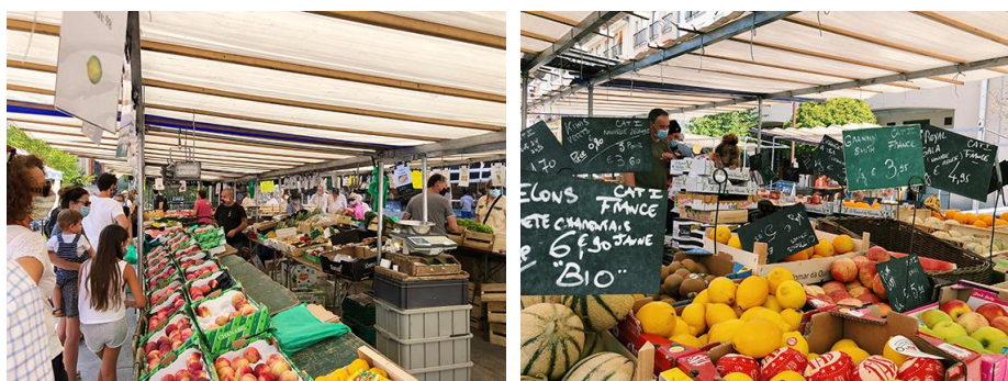
Le marché (@Fontainebleau Tourisme - cliquez sur les images pour obtenir les HD)

Marché de Fontainebleau : les mardi, vendredi et dimanche matin, en cœur de ville. Classé « Marché d'exception » par Le Conseil National des Arts Culinaires, plus de 100 commerçants alimentaires et non alimentaires s'installent dans cet espace de 4 500 m 2 pour proposer une offre de produits variée et qualitative. C'est l'un des marchés les plus réputés de Seine-et-Marne.