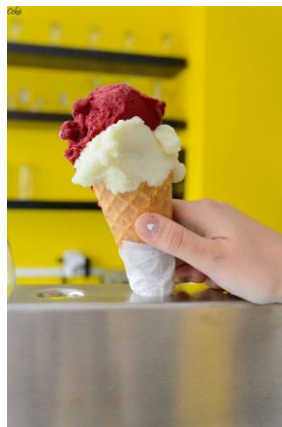
ViaVeneto (@ViaVeneto - cliquez sur les images pour obtenir les HD)

La destination regorge de nombreux glaciers avec une belle offre, notamment de glaces artisanales, et un large choix de parfums. A Fontainebleau, on retiendra la Gelateria Via Veneto . Aussi, dans les jardins du château de Fontainebleau et dans la ville impériale, des glaciers food-trucks sont également présents.