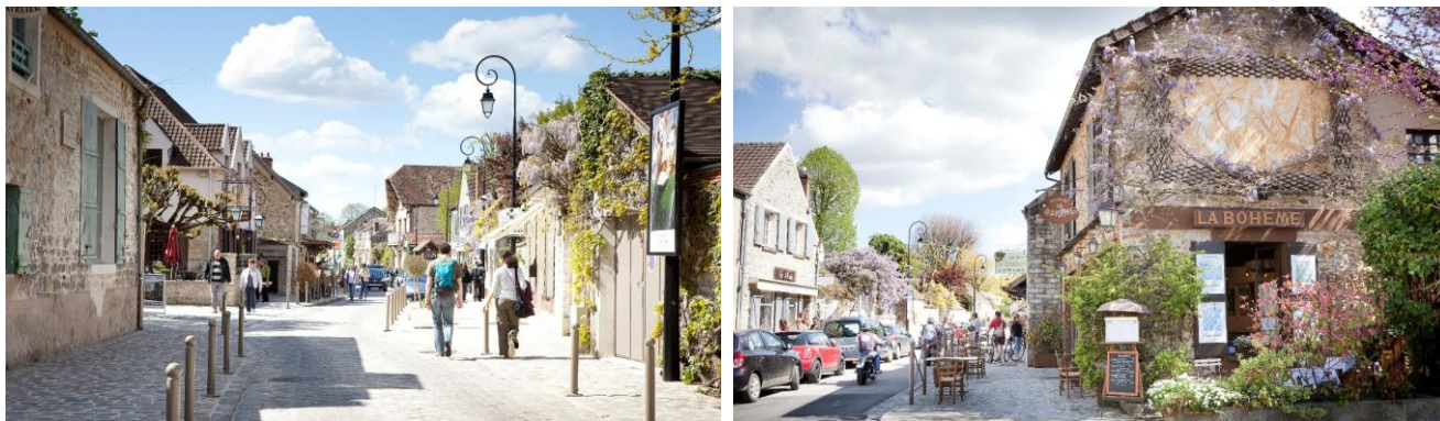
Barbizon (cliquez sur les images pour obtenir les HD)

Et pour la balade digestive , c'est que du beau et de la nature qui attendent simplement les visiteurs : les jardins du château de Fontainebleau, son parc et son magnifique canal (idéal pour la sieste sous les arbres), sans oublier la forêt de Fontainebleau et ses sentiers de sable (idéal de partir depuis la Faisanderie, située juste derrière le campus de l'INSEAD).