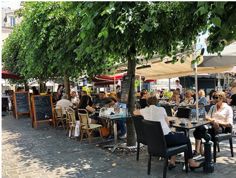
Place Napoléon (@Fontainebleau Tourisme - cliquez sur l'image pour obtenir la HD)

Fontainebleau, mai 2021 - Nous avons reconsidéré à bien des égards le plaisir de déjeuner, dîner au restaurant, prendre un verre à une terrasse de café, ou simplement savourer un expresso sans oublier son petit verre d'eau ou encore la joie de trouver le lieu parfait de pique-nique ! Il est vrai qu'à la maison la distance entre la table de travail et la cuisine est un peu courte...et que partager ses moments avec ses proches et ses amis manque à un tel point que cette réouverture prochaine est un signal de plaisir important. La destination Pays de Fontainebleau a beaucoup à vous offrir pour des plaisirs simples et bons !