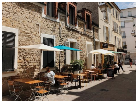
Place Napoléon et Rues piétonnes de Fontainebleau